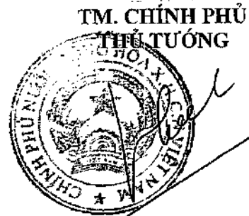
Nguyễn Xuân Phúc

3. Các đơn vị trực thuộc Tổng công ty Đường sắt Việt Nam, các công ty con của Tổng công ty Đường sắt Việt Nam căn cứ quy định của pháp luật tương ứng với hình thức pháp lý của mình và Điều lệ này để xây dựng Điều lệ hoặc Quy chế tổ chức và hoạt động của mình, trình cơ quan có thẩm quyền phê duyệt. Điều lệ hoặc Quy chế tổ chức và hoạt động của các đơn vị trực thuộc, các công ty con không được trái với Điều lệ này./.